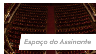
Espaço do Assinante