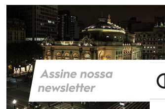
Assine nossa newsletter