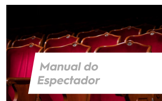
Manual do Espectador