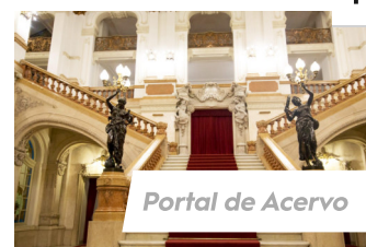
Portal de Acervo