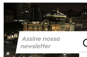
Assine nossa newsletter