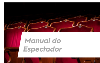
Manual do Espectador