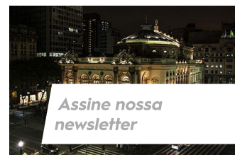
Assine nossa newsletter