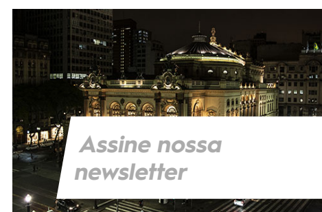
Assine nossa newsletter