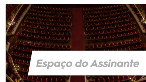
Espaço do Assinante