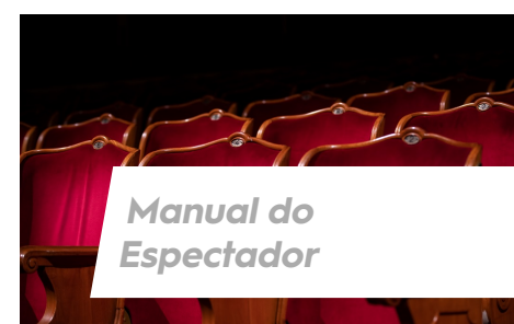
Manual do Espectador