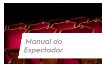
Manual do Espectador