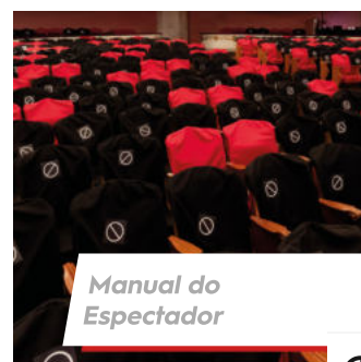
Manual do Espectador